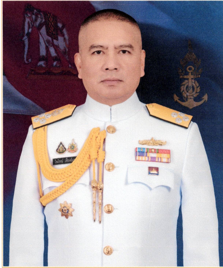
พลเรือเอก ไพโรจน์ เฟื่องจันทร์ ผู้บัญชาการทหารเรือ